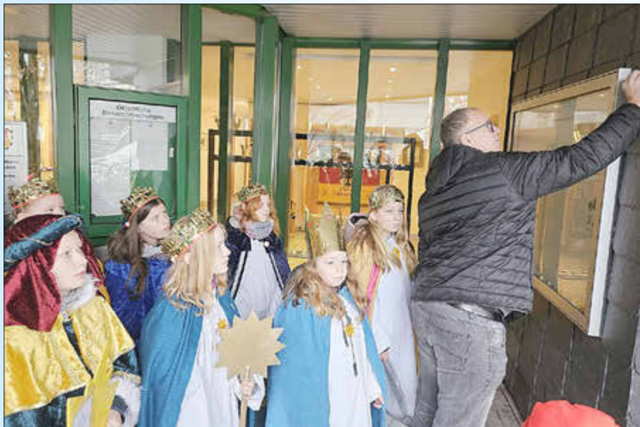
Der Segensgruß wird am Rathaus angebracht.

„Ich bin sehr froh darüber, dass Ihr auch in diesem Jahr wieder unser Haus besucht und freue mich, dass Ihr in so großer Zahl dazu beiträgt, weltweit Kindern, denen es nicht so gut geht, durch Eure Sammlung zu helfen,“ so Bürgermeister Jüngerich und übergab ihnen eine Spende.