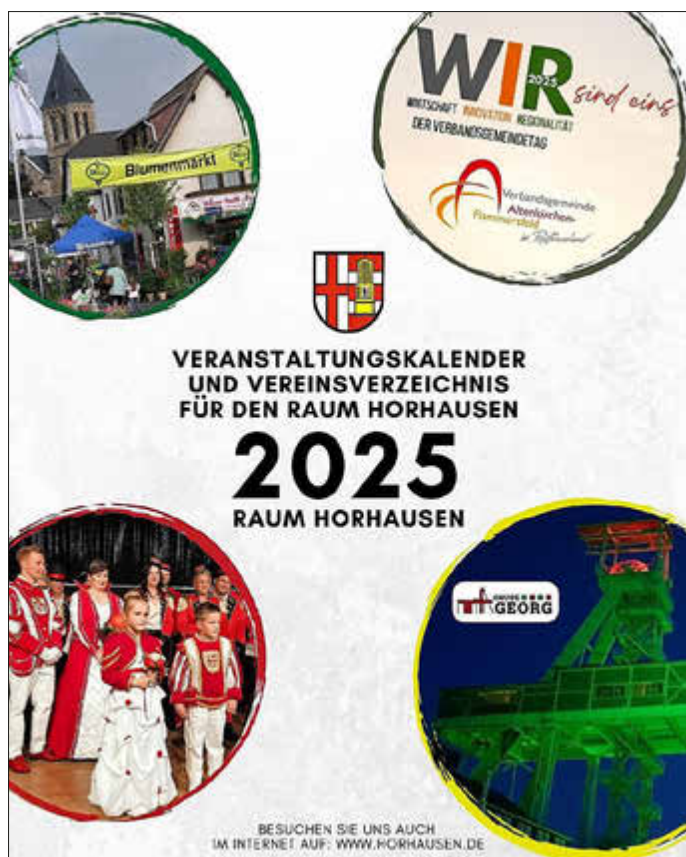
Titelseite des Veranstaltungskalenders für den Raum Horhausen

das Verzeichnis geben einen umfassenden Einblick in das lebendige Vereins- und Kulturleben unserer Region und fördern die Vernetzung zwischen den Vereinen. Mein Dank gilt allen, die zur Erstellung beigetragen haben, insbesondere der Arbeitsgruppe „Veranstaltungen“, betonte der Ortsbürgermeister.