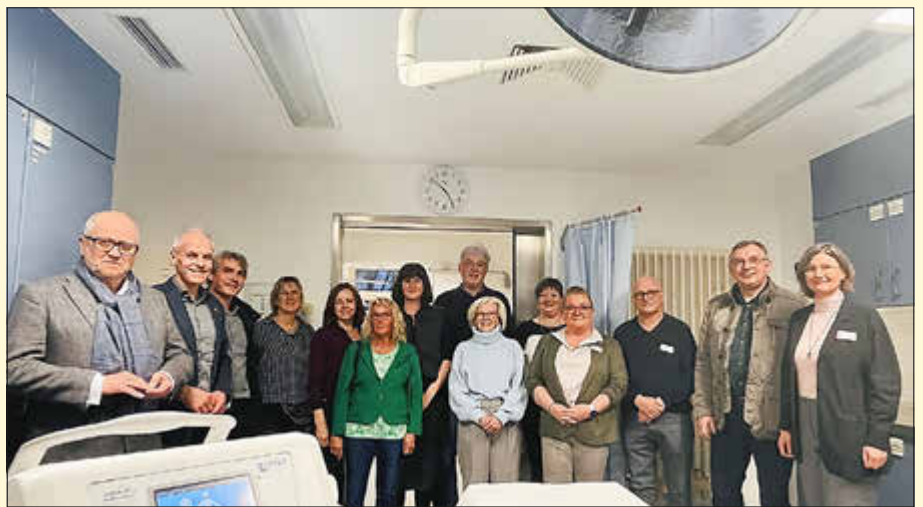
Bürgermeister und Landrat und zeigten sich beeindruckt von dem hohen Engagement aller Mitarbeiterinnen und Mitarbeiter im MVZ Altenkirchen. Ziel ist es, dass medizinische Angebot weiter auszubauen.