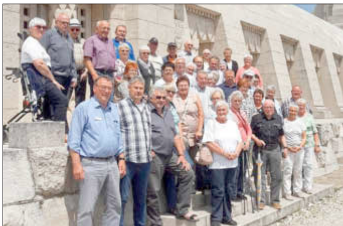
Die Reisegruppe auf der Treppe zum Gebeinehaus in Verdun