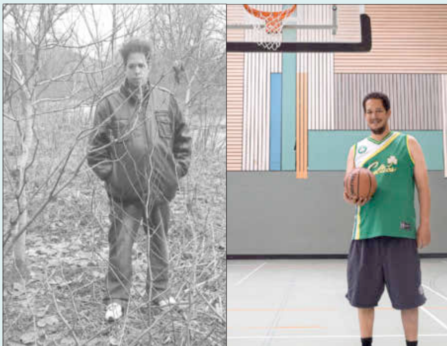
Die erste Fotografie spiegelt ein Alltagsbild wieder, während der Fantasie für das zweite Foto fast keine Grenzen gesetzt waren und die Teilnehmenden ein Outfit und eine Situation völlig frei wählen konnten.

Öffnungszeiten: Montag bis Dienstag 7.30 Uhr bis 17.30 Uhr, Mittwoch 7.30 Uhr bis 12 Uhr, Donnerstag 7.30 Uhr bis 18 Uhr, Freitag 7.30 Uhr bis 13 Uhr.