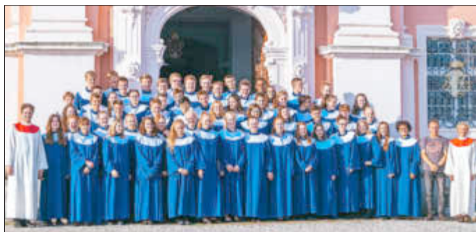
Der Eintritt ist frei, um eine Spende wird gebeten. Orgelnacht taucht die Basilika in farbiges Licht