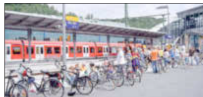
Sonderzug (im Bahnhof Wissen)

Die Sonderzüge der Bahn haben sich in den letzten Jahren bewährt und helfen, den Radlern das Siegtal nicht nur aus unterschiedlichen Perspektiven kennen zu lernen sondern auch Steigungen leicht zu überwinden.