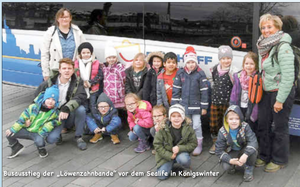
Busausstieg der „Löwenzahnbande“ vor dem Sealife in Königswinter