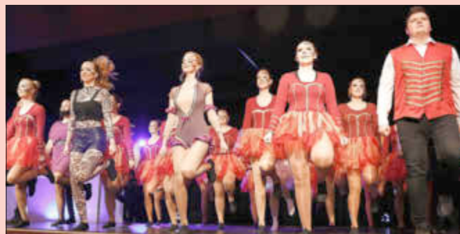
Tanzgruppe „Just for Fun“ der KG Oberlahr

SPORTING Taekwondo: Eugen Kiefer verschiedene nationale und internationale Titel als Mannschaft „SPORTING Taekwondo“