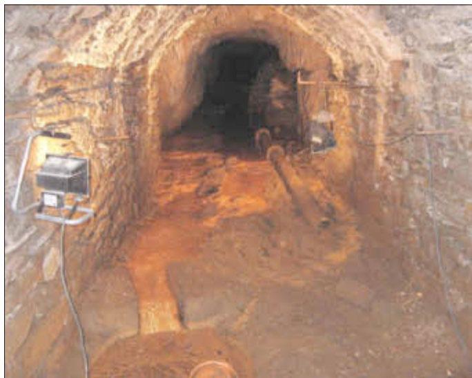
Ein Blick in den „Tiefen Guldenhardtstollen“

Seit vielen Jahren führt das Bergbaumuseum des Kreises Altenkirchen in Herdorf-Sassenroth Exkursionen zur montangeschichtlichen Vergangenheit durch. Nun wird erneut eine Tour rund um die Grube Guldenhardt in Dermbach angeboten. Auf einem Rundweg von 3000 Metern zeigt sich hier eine Ansammlung hochkarätiger, teilweise einzigartiger Bergbaurelikte. Architekt Carsten Trojan (Herdorf) hat die Geschichte des Bergwerks erforscht.