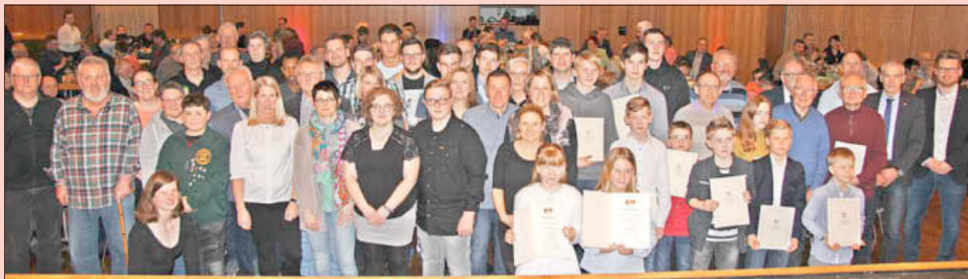
Einzel sportler sowie Vertreter von Mannschaften wurden für ihre Leistungen mit Urkunden ausgezeichnet.