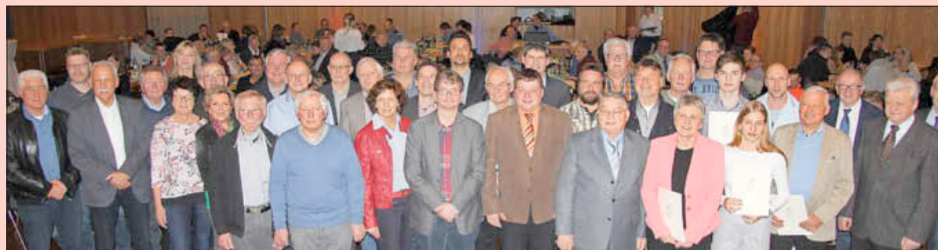
Auch die Ehrenamtler wurden für ihre überaus wichtige Arbeit gewürdigt.

SSV Almersbach/Fluterschen: Mannschaft Saison 2014/2015 Staffelsieger C-Klasse, 2. Mannschaft Saison 2014/2015 Staffelsieger D-Klasse1. Mannschaft Saison 2014/2015 Kreispokalsieger C/D Klasse Saison 2015/2016 Staffelsieger B-Klasse Saison 2015/2016 Kreismeister der B-Klasse