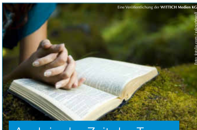
Eine Veröffentlichung der WITTICH Medien KG

LINUS WITTICH Lokal informiert. Druck. Internet. Mobil.