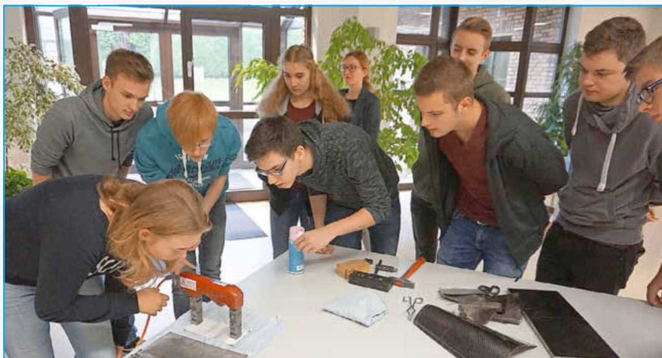
Wie sieht der Alltag von Ingenieuren aus? – Praktische Einblicke gibt der Workshop FutureING im Oktober bei WERIT

Die Veranstaltung ist kostenfrei. Informationen zum Unternehmen finden interessierte Schüler/innen unter: www.werit.de