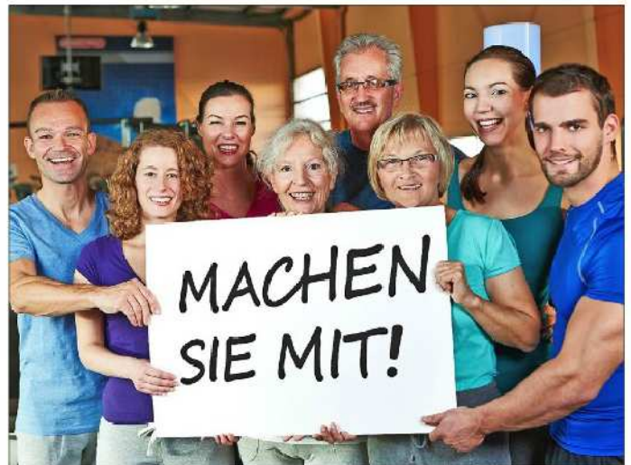
Rehasport im KSC - machen Sie mit!

Die Kostenübernahme erfolgt durch Ihre Krankenkasse. Informationen unter 02684-956000 oder zu den Kurszeiten vor Ort: KSC Altenkirchen, Siegener Straße 25, 57636 Mammelzen