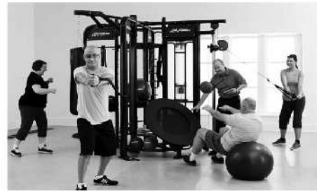
NEU: Trainingsplattform Syngry