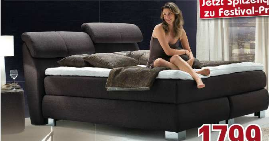
belcanto Boxspringbett best. aus: Kaltschaum-Topper, Obermatratze 7-Zonen-Taschenfederkern, Untermatratze Taschenfederkern, Liegefläche ca. 180x200 cm Art. 33597