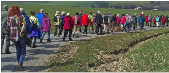
Blick von der Umgehungsstraße (Friedhof) in Richtung Beulskopf.