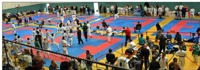
Impression vom WW-CUP in Puderbach

Der Internationale WW-CUP ist seit Jahren eine feste Größe in der Karate Welt, doch dieses Jahr sollten einige Rekorde fallen. Es waren 102 Vereine mit 795 Startern aus 3 Kontinenten/16 Nationen dabei. Alle diese Zahlen bedeuten neue Rekorde. Es wurde auf 7 Wettkampfflächen auf höchstem Niveau gekämpft. Bei den Teilnehmern waren auch amtierende oder ehemalige europä- und weltmeisterschaftsplatzierte Athleten mit am Start. Vom KSC Karate Team konnten insgesamt 3 Goldmedaillen, 5 Silbermedaillen und 4 Bronzemedaillen erkämpft werden, was einen hervorragenden Platz 6 in der Medaillenwertung ergab und bewies seine Spitzenposition im internationalen Vergleich. Mit anwesend waren auch die Deutschen Bundestrainer die einige Ihrer Schützlinge genau beobachteten. Auch von vielen Besuchern aus der Region konnte so Karate hautnah erlebt werden, und die Stimmung in der Halle hatte den gesamten Tag einen ganz besonderen Flair. Wer jetzt selbst mit Karate im KSC beginnen möchte, ist herzlich eingeladen, diese Sportart ganz unverbindlich und kostenfrei bei uns auszuprobieren. Wir bieten Karate in Puderbach, Horhausen und Altenkirchen in insgesamt 22 Gruppen an. Die jüngsten sind erst 2 Jahre alt, und unsere Späteinsteiger sind zum Teil bereits über 60. Mehr Informationen im Internet ( www.ksc-puderbach.de ), per Telefon (02684-956000) oder direkt vor Ort.